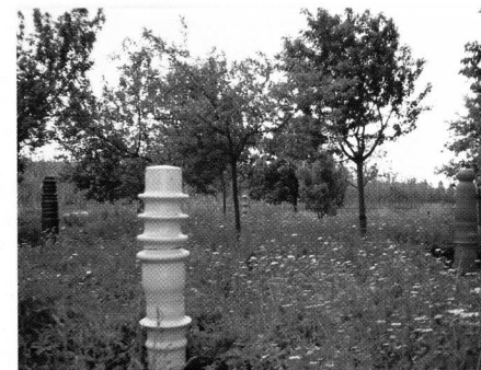
Paula Groote: "Gedenksteden", klei h 2.00 m.